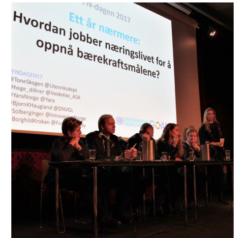
På FN-dagen arrangerte FOKUS og FN-organisasjonene i Norge seminar om næringslivet og bærekraftsmålene.