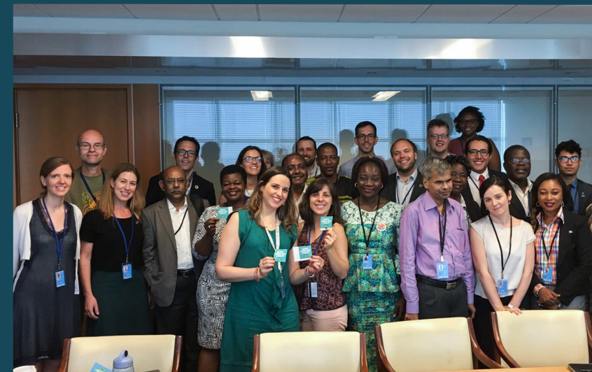
Together 2030 på HLPF i NYC

Verden over er et uavhengig sivilsamfunn viktig for å fremme menneskerettigheter og inkluderende, fredelige og bærekraftige samfunn. ForUM samarbeider med gode, representative globale sivilsamfunnsorganisasjoner og -koalisjoner med felles mål, og som har dokumentert evne og kapasitet til å skape positiv endring.