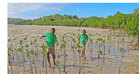
Plantede mangrovetrær på Fiji. Mangrovetrær absorberer effektivt karbon, beskytter mot jorderosjon og er viktig for å bevare livet i havet.

Utgitt av Forum for utvikling og miljø 2018