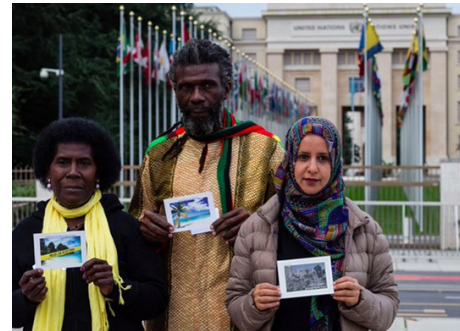
Control Arms-partnere fra Papua Ny-Guinea, Jamaica og Jemen ber FN-delegater fra over hundre land på Arms Trade Treaty-møte i Genève om å stanse uansvarlig våpenhandel som fører til enorme menneskelige lidelser.

Det norske regelverket for våpeneksportkontroll inneholder ikke spesifikt forbud mot eksport av forsvarsmateriell der det er en overveiende risiko for at det vil bli brukt til å fasilitere brudd på menneskerettigheter og humanitær rett, slik ATTs artikkel 6 og 7 sier. Etter innspill fra ForUM og Røde Kors ba Stortinget regjeringen vurdere dette. I årets melding svarer regjeringen at forvaltningen er forpliktet til å følge de folkerettslige forpliktelsene som Norge har inngått, og "Regjeringen mener derfor at det ikke er nødvendig, hverken fra et nasjonalt eller folkerettslig ståsted, å foreta endringer i et veletablert og innarbeidet regelverk." Dersom man skulle flytte ATT artiklene 6 og 7 til lov eller forskrift, vil dette medføre et mer fragmentert og uoversiktlig regelverk. Dette er etter vårt syn ikke en reell utredning, men bærer preg av ansvarsfraskrivelse. Hvordan vi implementerer ATT bidrar til å sette en standard også for andre lands implementering, noe ForUM påpekte på høring i 2017.