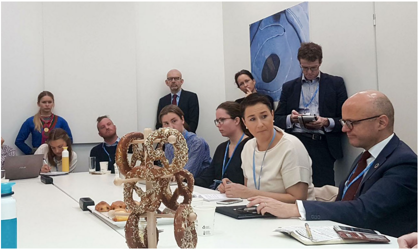
ForUM var representert i den norske regjeringsdelegasjonen under klimaforhandlingene i mai og november. Her arrangerer ForUM møte under COP23 mellom organisasjonene og den norske delegasjonen ledet av klima- og miljøminister Vidar Helgesen.

regelmessige møter mellom medlemmene som var tilstede og den norske delegasjonen. Gruppen presenterte også sitt skriftlige innspill til forhandlingene for klima- og miljøministeren i Oslo forut for forhandlingene.