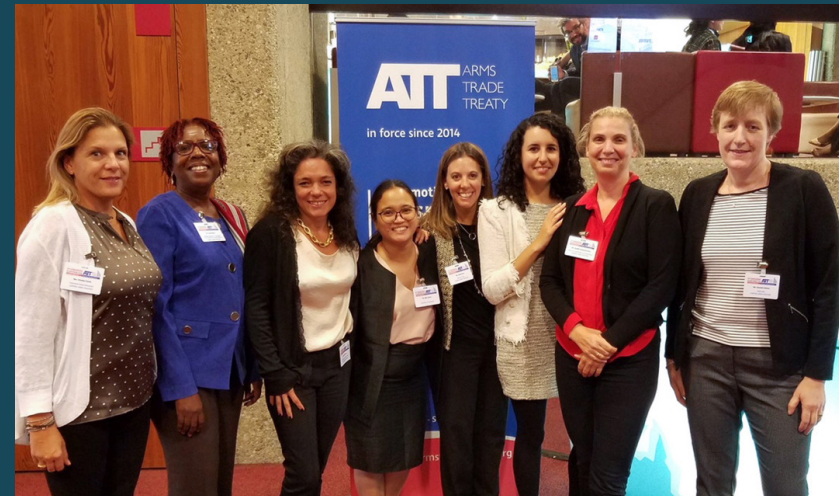
ForUM sammen med Control Arms' koalisjonspartnere i Libanon, Trinidad og Tobago, Argentina, Filippinene, USA og England under statspartsmøtet til Arms Trade Treaty i september 2017. Vold mot kvinner blir enda farligere med lett tilgang til våpen. Sammen med Control Arms har ForUM fått gjennomslag for strengere regler for våpenhandel for å forebygge overgrep samt kjønnsbasert og annen vold.