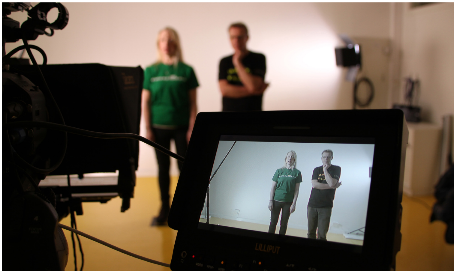
Fra innspillingen av filmene om FNs bærekraftsmål med ForUMs medlemmer.