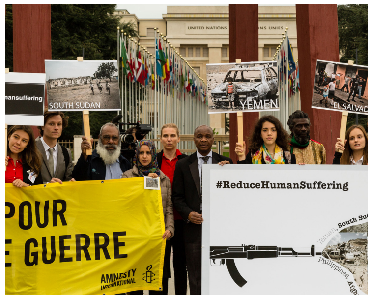
Sammen med partnere i den globale sivilsamfunnskoalisjonen Control Arms arrangerte ForUM en kampanje mot uansvarlig våpenhandel som fikk oppmerksomhet i flere internasjonale medier. Det skjedde under statspartsmøtet for FNs Arms Trade Treaty i Genève i september, hvor ForUM deltok.