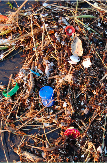
En nullvisjon om marin forøpling ble vedtatt av FN's miljøforsamling i desember, anført av Norge og ForUMs delegasjonsrepresentant WWF.