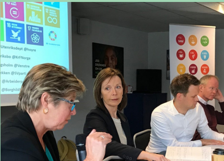
Under ForUMs årsmøte diskuterte politikere fra Høyre, Venstre, KrF og SV hvordan FNs bærekraftsmål kan nås.

Nullvisjon or marin forsøpling vedtatt av FN, anført av Norge med ForUM representert ved WWF i delegasjonen