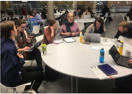
Fiji var i 2017 vertsland for klimaforhandlingene (COP23). Landet ble i 2016 hardt rammet av orkanen Winston. (bildet er nå lagt i dropbox-mappen)

Til stor glede har regjeringen meldt at de ønsker å ta ledelsen for arbeidet for rene og sunne hav. Sammen med ForUMs delegasjonsrepresentant fra WWF har de under UNEA3 arbeidet aktivt for en nullvisjon for marin forøpling i forhandlingene og denne ble vedtatt. Dog gjenstår en konkretisering av tiltakene for å oppnå nullvisjonen. Norge dumper fortsatt gruveavfall i fiskerike fjorder, og i 2017 kom et bekymringsverdig lovforslag om å åpne opp for mineralutvinning på havbunnen i sårbare områder, noe som kan få vidtrekkende miljøkonsekvenser. ForUMs havgruppe har sendt et felles høringsssvar om lovforslaget, og vil følge opp med den nye klima- og miljøministeren i 2018.