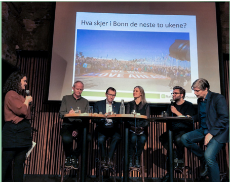
Tar Norge klimaregningen? Fire norske partier diskuterer en rapport fra Kirkens Nødhjelp, WWF Verdens naturfond, Regnskogsfondet og ForUM som viser at norsk klimafinansiering er redusert.