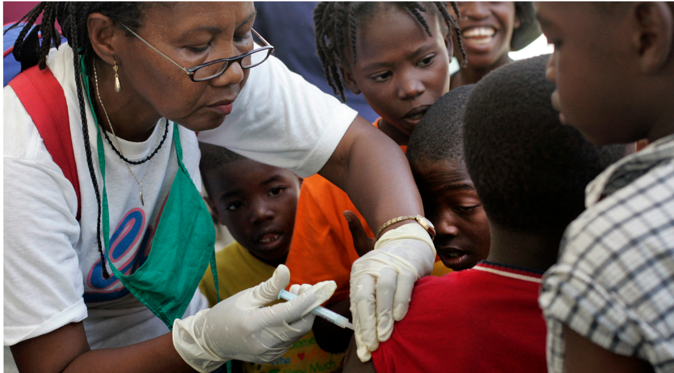
Tilgang til vaksiner, medisiner og helsetjenester trengs for å redde liv og å nå bærekraftsmålene. Her administrerer leger vaksiner på Haiti.

Verden går framover på mange områder. Andelen ekstremt fattige i verden har blitt halvert i løpet av noen tiår, ifølge FN. Likevel er utfordringene fortsatt meget store. Skillet mellom fattig og rik har aldri vært større enn i dag. Og forskjellen mellom kvinner og menn øker mest.