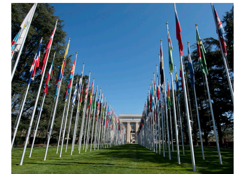
ForUM deltok på FNs årlige forum for næringsliv og menneskerettigheter i Genève i november. Et aktsomt og ansvarlig næringsliv trengs for å nå bærekraftsmålene.