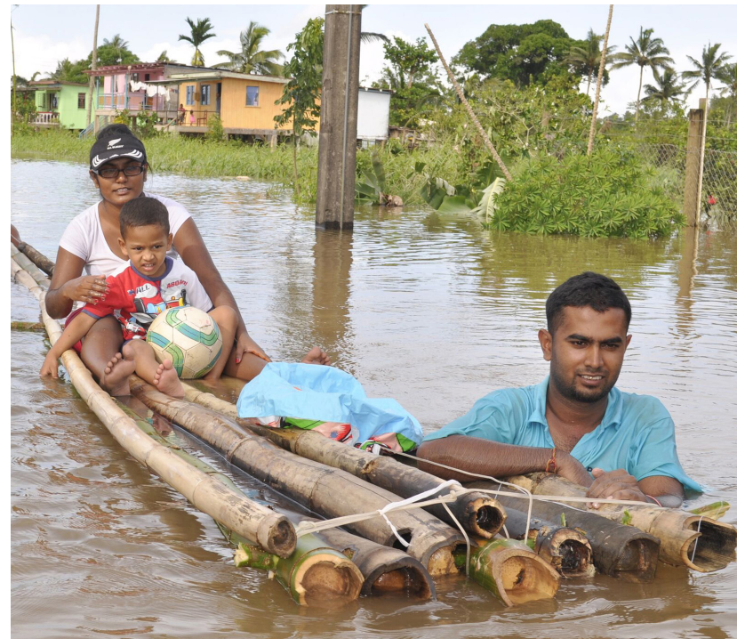
Fiji var i 2017 vertsland for klimaforhandlingene (COP23). Landet ble i 2016 hardt rammet av orkanen Winston.