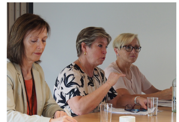
Hvordan kan Norge bidra til å utrydde sult? ForUMs matsikkerhetsgruppe inviterte politikere fra Venstre, Høyre og Senterpartiet til debatt i juni.

Innspillsdokumentet ble i en revidert utgave sendt til utenriksministeren med forespørsel om et møte i desember 2017. En konsultasjonsprosess er varslet å finne sted i første halvdel av 2018. ForUM deltok også på viktige nasjonale konsultasjonsorganer om matsikkerhet, FAO-komiteen, og den viktigste internasjonale konferansen for matsikkerhet, CFS (Committee for World Food Security).